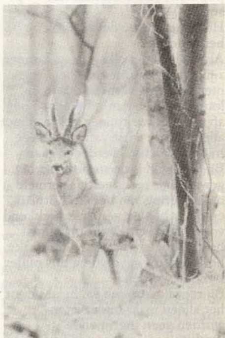
Ongevallen met reeën worden door wildspiegels aanmerkelijk teruggedrongen.

de burgemeester van Vorden, landgoedeigenaren en jacht-opzichters. De medewerking is volgens Gabriël optimaal.