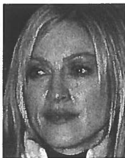
Madonna – mal findet sie die Jagd gut, mal nicht

Die Popikone Madonna (44) wird immer schrulliger. Jüngst hat sie auf ihren englischen Ländereien die Jagd auf Rebhühner verboten, weil sie die Rache reinkarnierter Rebhühner fürchtet. Als Anhängerin einer esoterischen Lehre glaubt sie, dass die getöteten Vögel in anderer Gestalt Vergeltung üben könnten. Ihr Ehemann Guy Ritchie zeigt kaum Verständnis für die neue Laune, zumal auch die Einnahmen aus der Jagd verloren gehen. Bisher war Madonna selbst leidenschaftliche Jägerin und frönte jedes Wochenende der Passion.