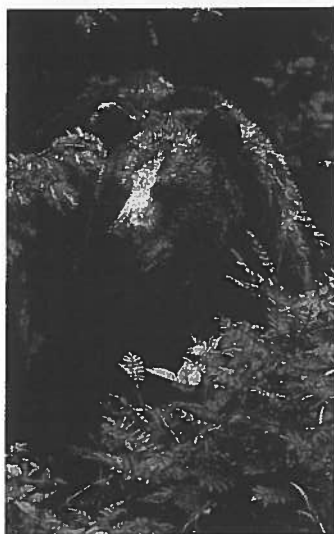
Die Anzahl der Bären in Finnland steigt und lässt eine stärkere Bejagung zu