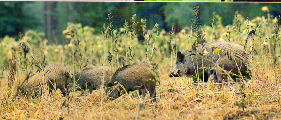
Ook in de winter is de knol van de topinamboer erg in trek.