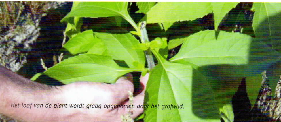
Het loof van de plant wordt graag opgenomen door het grofwild.