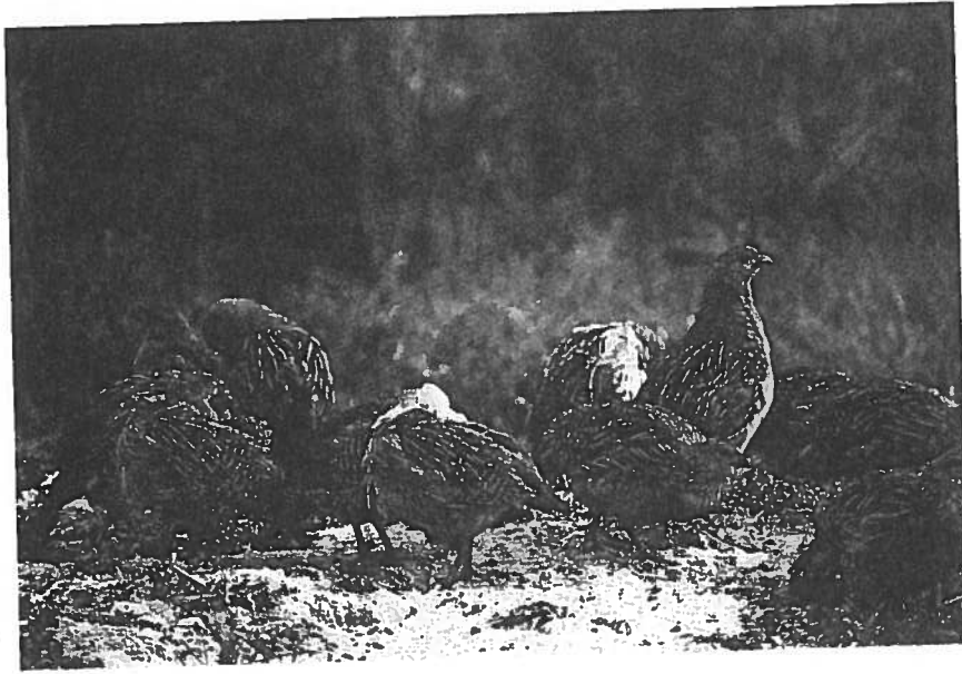
In der Nähe der „Rebhühnstreifen“ (Hintergrund) künstlich angelegte Sand-schüttungen werden von den Hühnern regelmäßig aufgesucht