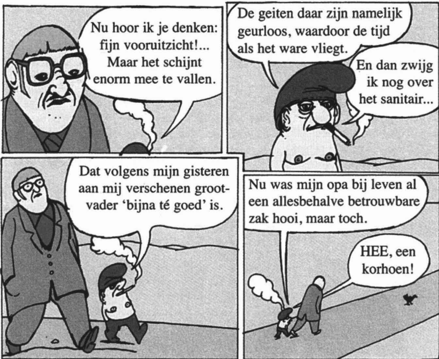
Onderdeel van 'De Wandeling' uit: Daar gaat fout varken, van Gumbbah (2006, De Harmonie, Amsterdam).

EJ, Orchidee 8, 7443 LG Nijverdal, eef_jansen@hetnet.nl