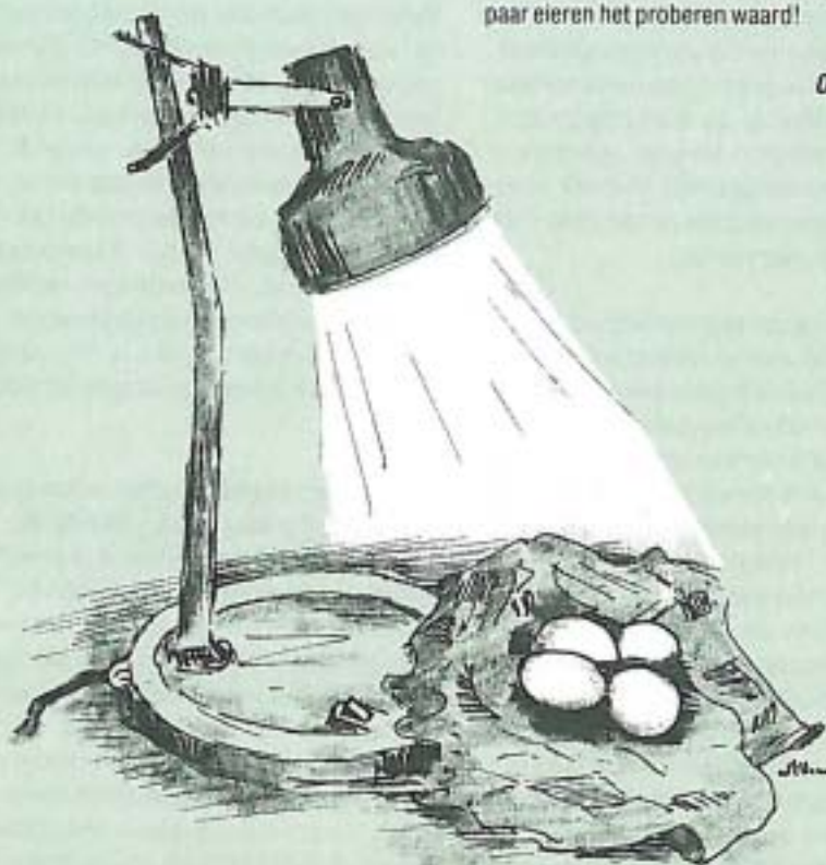
Illustratie: Ome Willem