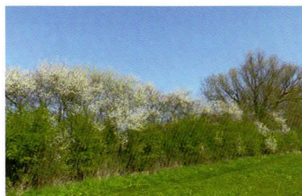
Een houtwal.

Veel heggen en houtwallen zijn uit het Sallandse landschap verdwenen. En dat is zonde. Want niet alleen zijn deze heggen en houtwallen een lust voor het oog, veel vogels en andere dieren vinden er een schuilplek en voedsel. Een van de initiatieven van de 'Patrijs van Salland' is het weer terug planten van heggen en houtwallen.