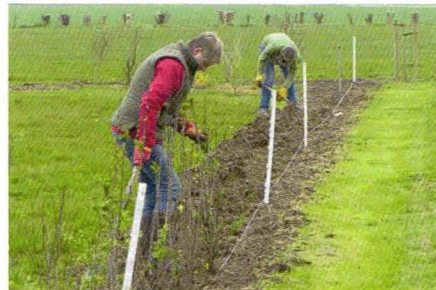
In 2015 is 390 meter heg gepoot.

Stel: uw perceel ligt in een gebied waar patrijzen zitten. En u wilt de patrijs helpen met de aanplant van een heg of houtwal. PvS kan dan helpen. Wij bekostigen het plantgoed en planten ook aan. Voor zover we hiervoor nog geld in kas hebben!