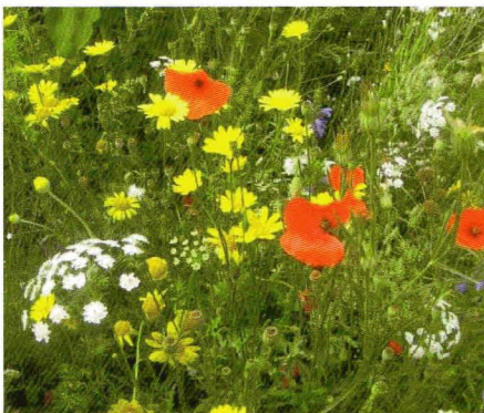
Kruidenranden zorgen voor voedsel en bescherming.

Om meer variatie in beplanting te krijgen, kunnen delen van akkers (bijvoorbeeld randen) ingezaaid worden met kruidenmengsels. Deze bieden de patrijs (en andere dieren) voedsel (ze eten de zaden en knoppen), beschutting en de jongen vinden er insecten.