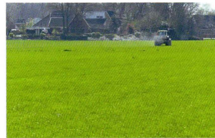
Monocultuur Engels raaigras.

Het ziet er groen uit, maar er leeft nog maar een beperkt aantal soorten planten en dieren. Sommige mensen spreken al van een 'groene woestijn'.