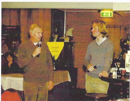
Twee FBE-bestuurders gaven hun mening over het vastleggen van data

cursus landelijk op één en hetzelfde niveau te krijgen. In april 2009 lukte dat en werd Dicks boek 'Reeënbeheer' gepresenteerd. 'Reeënbeheer' is ook de naam van de opleiding geworden. Het doel is bereikt, een landelijke cursus met een gecertificeerd examen in samenwerking met IPC de Groene Ruimte.