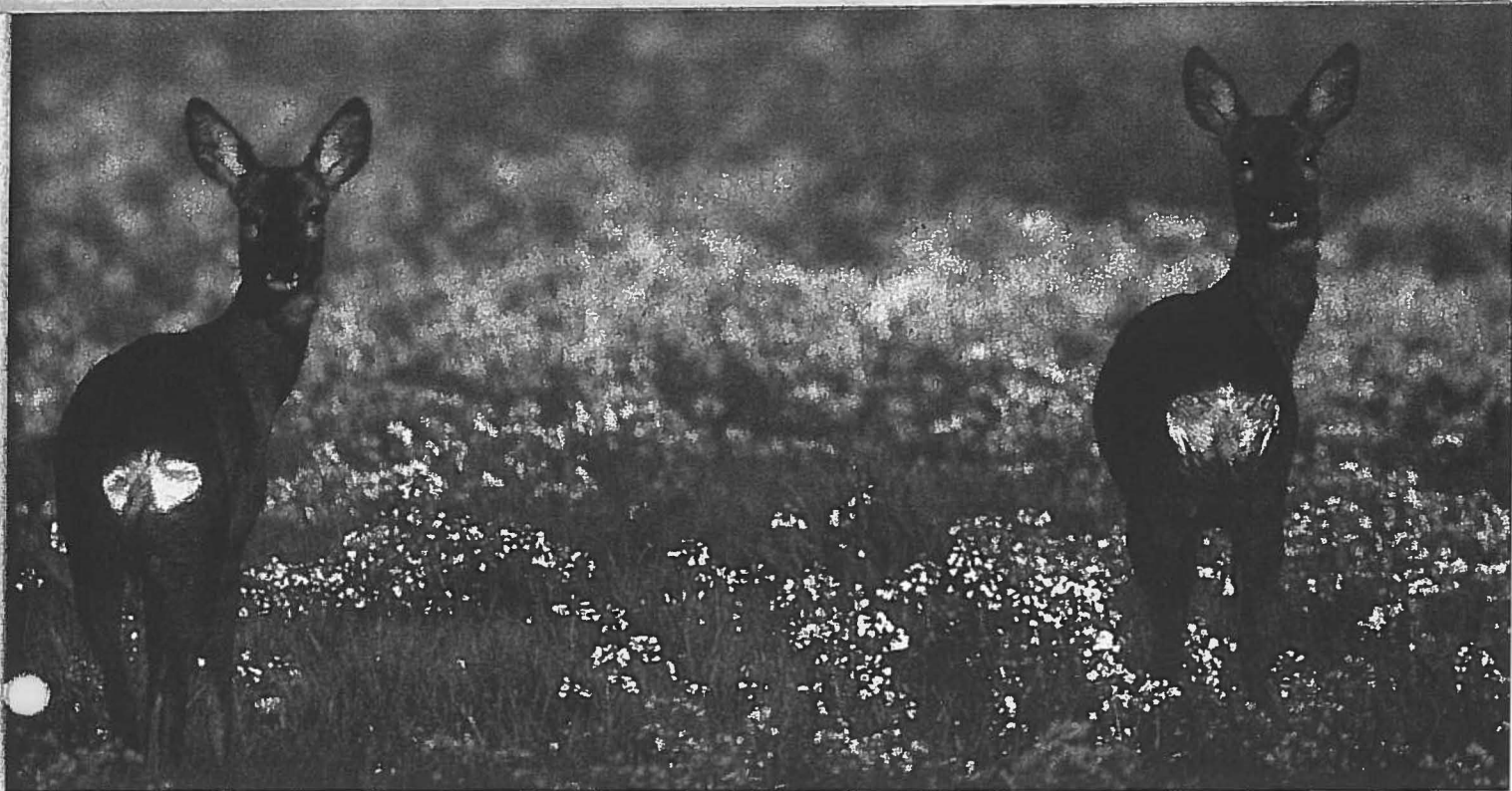
Kein Zweifel – zwei Schmalrehe: Nur wer dem Wild spitz von hinten zwischen die Keulen schauen konnte, darf sich zum Schuss entschließen

scheiden, leuchtet ein, denn die Tracht nötigt dem wachsenden Körper des Muttertiers ihren Tribut ab.