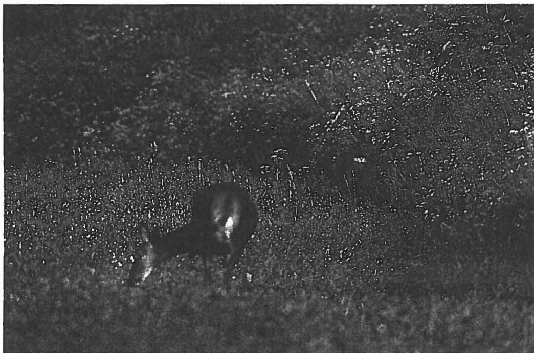
Obwohl sich Reh- und Rotwild hinsichtlich ihres Sozialverhaltens sowie ihrer Lebensraumansprüche deutlich unterscheiden, wurden für beide ähnliche jagdliche Vorgaben geschaffen

Die Jagd muß aus biologischen Gründen (wieder!) zum kalendarischen Ende des Herbstes (sprich: Weihnachten) enden. Dies ist wichtiger als die oft mißverständene Fütterungsmentalität, oft verbunden mit einer falsch eingesetzten Fütterungsstrategie. Eine effektive verkürzte Schalenwildbejagung ist aber nur möglich, wenn viele der unsinnigen Disziplinierungen des Jägers (Selbstzweck), die oft bar jedes biologischen