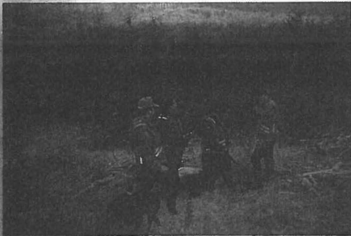
Die genaue Einweisung von Treibern und Schützen schließt Jagdunfälle nicht nur bei Bewegungsjagden weitgehend aus. Hochläufige, schnelle Hunde, wie der kurzhaarige Vorstehhund (vorne) sollten bei Anrührjagden allerdings geschnallt werden