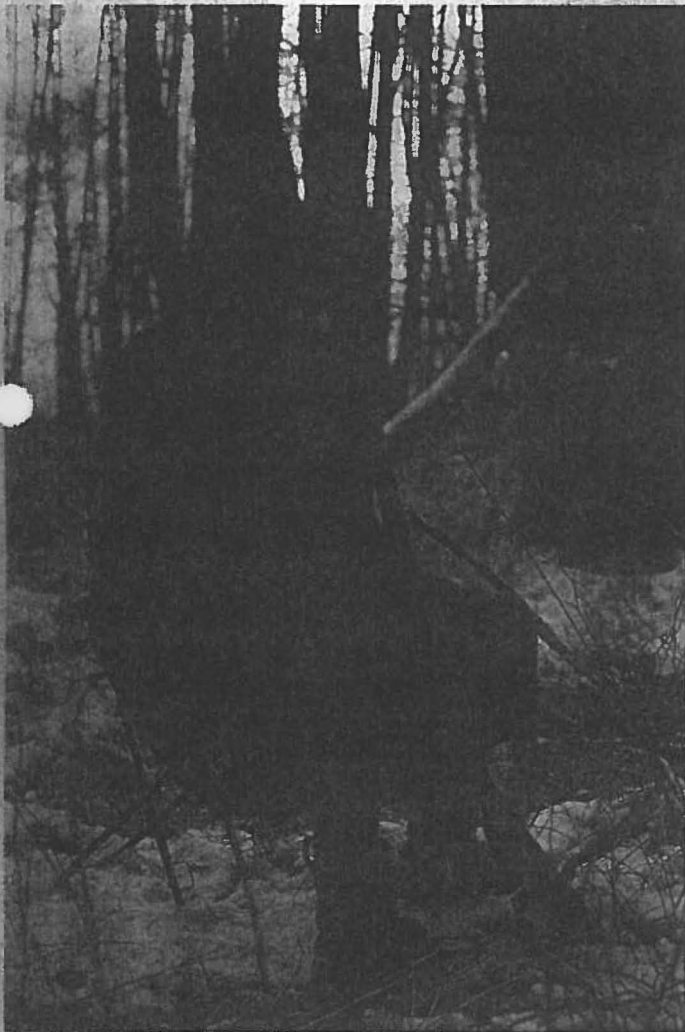
Wie geschlossene Kanzeln sind auch Sitzstühle und Ansitzstühle für Anrührjagden ungeeignet. Der Erfolg bleibt aus ...

Erhöhte Verantwortung trägt die Jagdleitung in der Vorbereitungsphase bezüglich der Einweisung der Treiber. Kartenskizzen bilden auch hier die Grundlage für die genaue Planung des Anrührens, damit die Treiber mit den Schützenständen während des gesamten Jagdablaufes nicht in Berührung kommen. Je nach Dickungsanteil an der Gesamtwaldfläche und Größe der einzelnen Dickungskomplexe