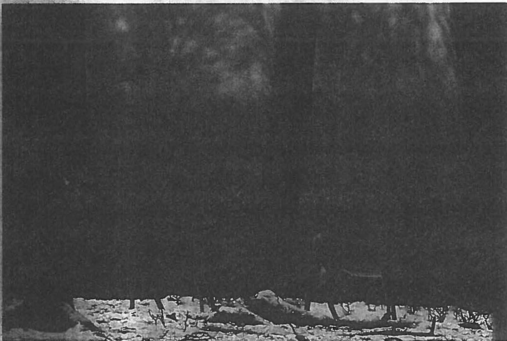
Ziel großräumiger Beunruhigungsjagden: Das Wild kommt relativ vertraut auf bekannten Wechsellinien und erlaubt somit sorgfältiges Ansprechen und einen sicheren Schuß