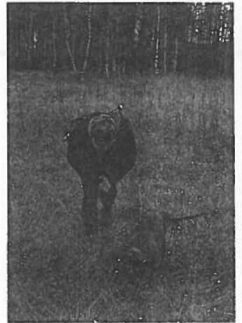
Nachsuchen gehören zur Jagd. Ihre Einplanung bei der Organisation von Bewegungsjagden gewährleistet einen reibungslosen Jagdablauf

Ansitz-Drückjagden sollten ohne Unterbrechung durchgeführt werden sowie je nach Witterung nicht mehr als drei Stunden dauern (fleischhygienerechtliche Vorschriften beachten!) und nicht zu spät beginnen. Auf gleichem Territorium dürfen Anrührjagden nicht allzuoft durchgeführt werden; es genügen von Oktober bis Dezember zwei Jagden, da durch häufigere Beunruhigung