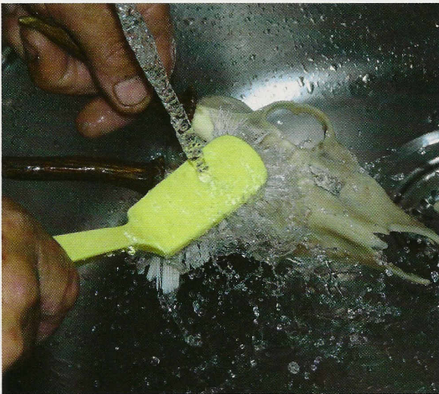
Onder de koude kraan wordt de schedel stevig afgeborsteld.