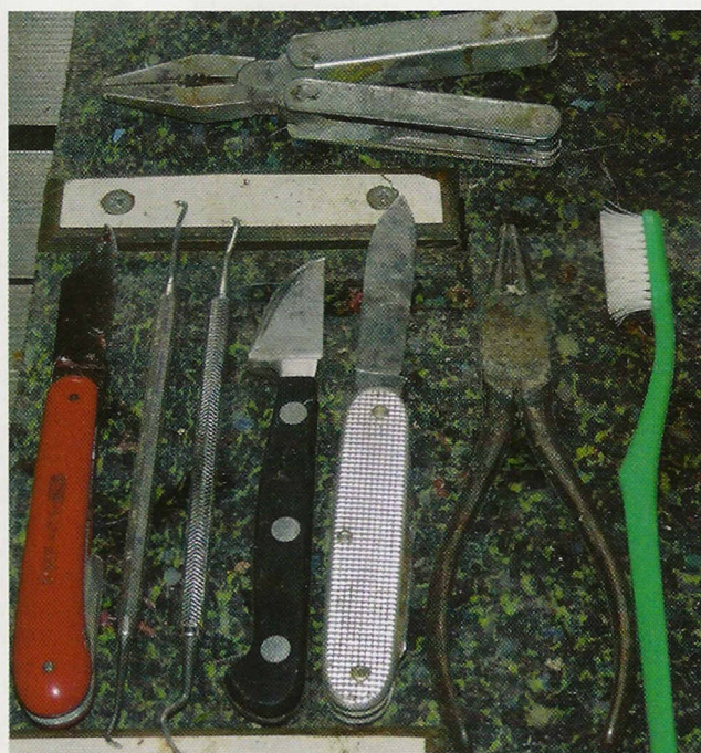
Het gebruikte gereedschap op een rijtje. Het tandartsgereedschap leent zich goed om te pulken in kleine openingen.

Wie wel eens een geweientoonstelling bezoekt, kan constateren dat niet iedere jager bedreven is in het prepareren van een trofee. Schedels die te kort of scheef zijn afgezaagd en vervolgens met een paar uitstekende, roestige schroeven zijn vastgezet. Of erger nog, zijn gelijmd, met gelige lijmresten aan de randen als resultaat. Of die niet goed afgekookt of gebleekt zijn, waardoor de schedel bedekt is met achtergebleven, bruinige vliesresten of geel is uitgeslagen van de vetresten. Het meest voorkomende euvel: ontbrekende neusvleugels als gevolg van te lang koken of onvoorzichtig zagen. We gingen daarom naar een ervaren schedelpreparateur om het hele proces van villen, zagen en afkoken tot en met het bleken en monteren van de schedel op de plank in beeld te brengen.