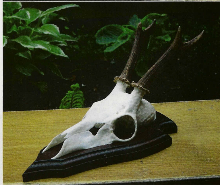
Met behulp van een gewieklem laat zich de schedel in een oogwenk op het plankje zetten.