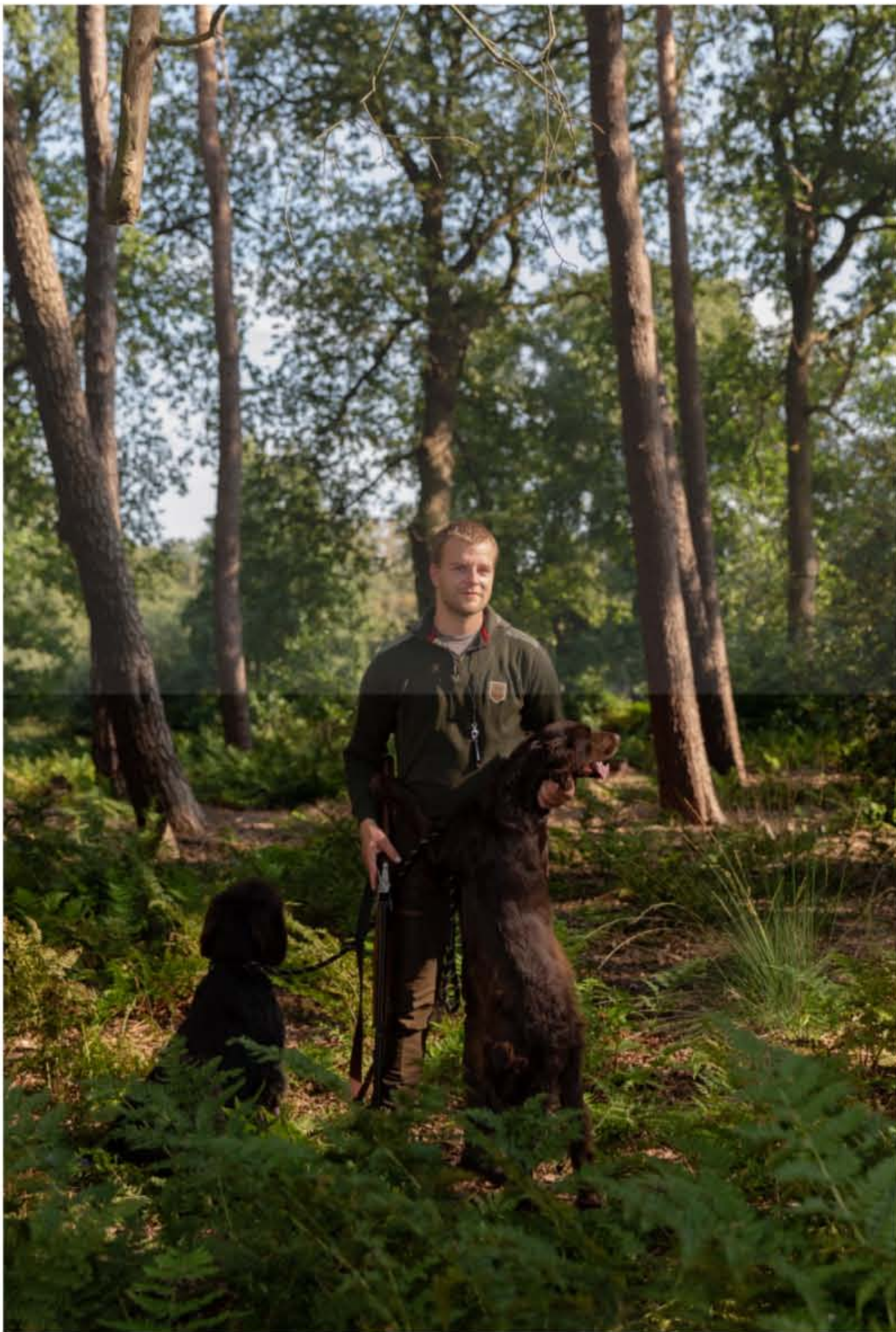
Maik Spanjaard