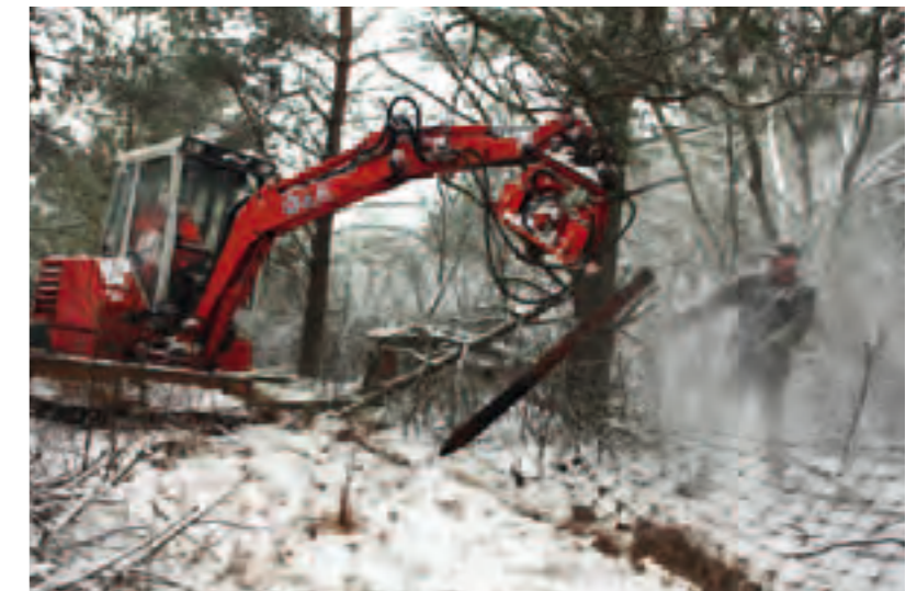
Bij Terlet, ten westen van het ecoduct over de A50, is in januari een nieuw raster geplaatst, om het zweefvliegveld zwijnevrij en veilig te houden.

De eerste doorgang in het raster van het park is klaar – maar nog niet in gebruik. Door de verlaging van het raster van 2,20 naar 1,10 meter komen het park en het Deelerwoud van Natuurmonumenten direct in verbinding met elkaar. 'Uniek', omschrijft ecoloog Geert Groot Bruinderink van onderzoeksinstituut Alterra in Wageningen de medewerking van het park: 'Voor het eerst in zeventig jaar komen er openingen in de rasters. Er moest nog wel wat bedacht worden voor de moeflons, die vanwege de exotenstatus het park niet uit mogen. De oplossing is gevonden in een verlaging voor de herten en reeën en poortjes voor de zwijnen, die te zwaar zijn voor de moeflons om doorheen te kunnen.'