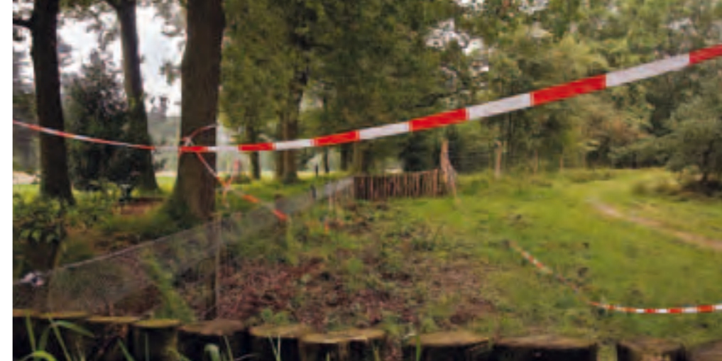
Het tijdelijk ongedaan maken van de in/uitsprong met rood/wit lint hielp niet. De herten sprongen er gewoon doorheen.