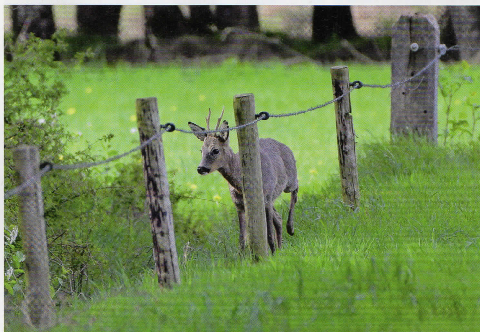
27 april: geveegde bok achter puntdraad. In eerste instantie wekt de bok een jeugdige indruk. Maar gelet op de al aardig diep liggende rozen, de oogkassen die beginnen te welven is hij misschien toch niet zo jong als hij op het eerste gezicht lijkt.