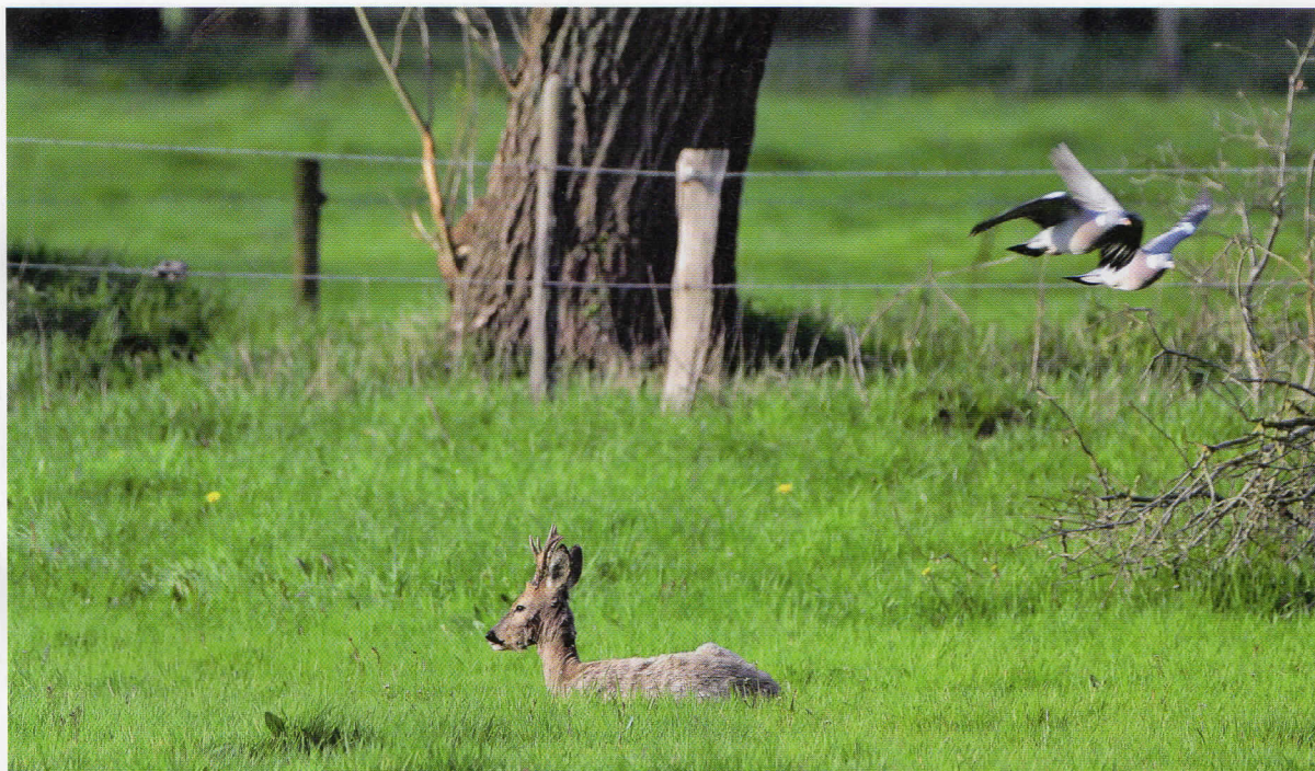
17 april: een jonge, geveegde bok. Verharing aan de kop en nek bijna voltooid. Stangen staan hoog op de schedel. Slanke nek (drager). Een jonge bok van 2 jaar of ouder. Immers, de jaarling heeft half april meestal nog niet geveegd.