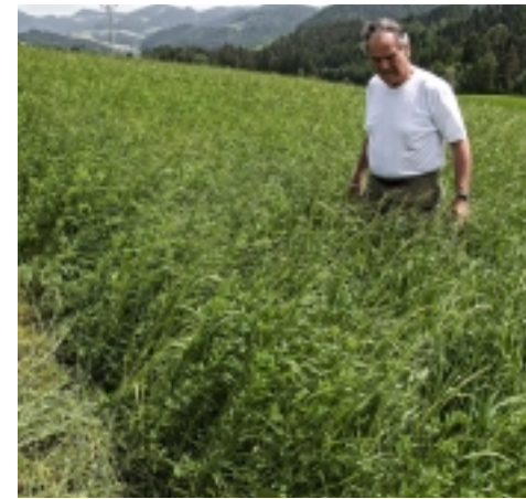
Der Wind erschwert die Suche zusätzlich.