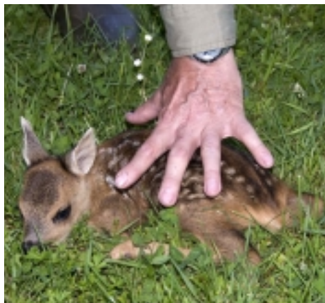
Ein 2 Tage altes Kitz zeigt noch deutlich den Drückinstinkt; hier hilft nur einsammeln und wegtragen.