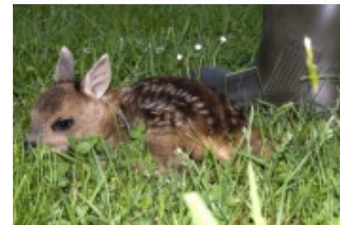
Ein Kitz in „Schuhgröße 40“ ist im hüfthohen Klee gras fast unsichtbar.