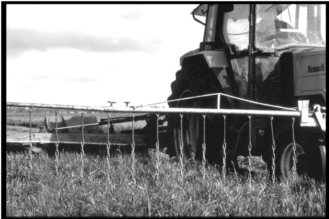
'Traditionele' wildredder in actie