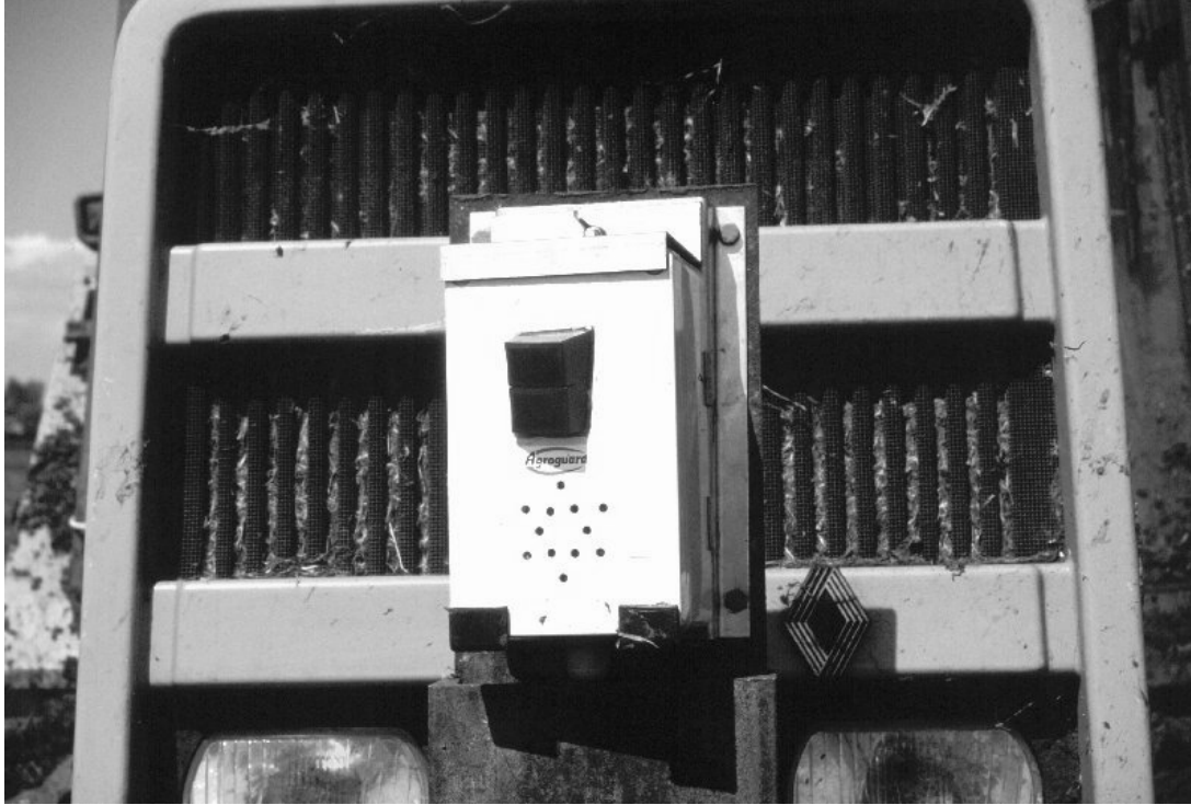
De infrarood-detector voorop de trekker gemonteerd

Het Deense systeem, dat nu exclusief montage al f 2.000,- à f 2.500,- kost, zou dan nog (veel) duurder in aanschaf worden. Daarmee wordt de prijs te hoog voor grootschalige toepassing op landbouwbedrijven.