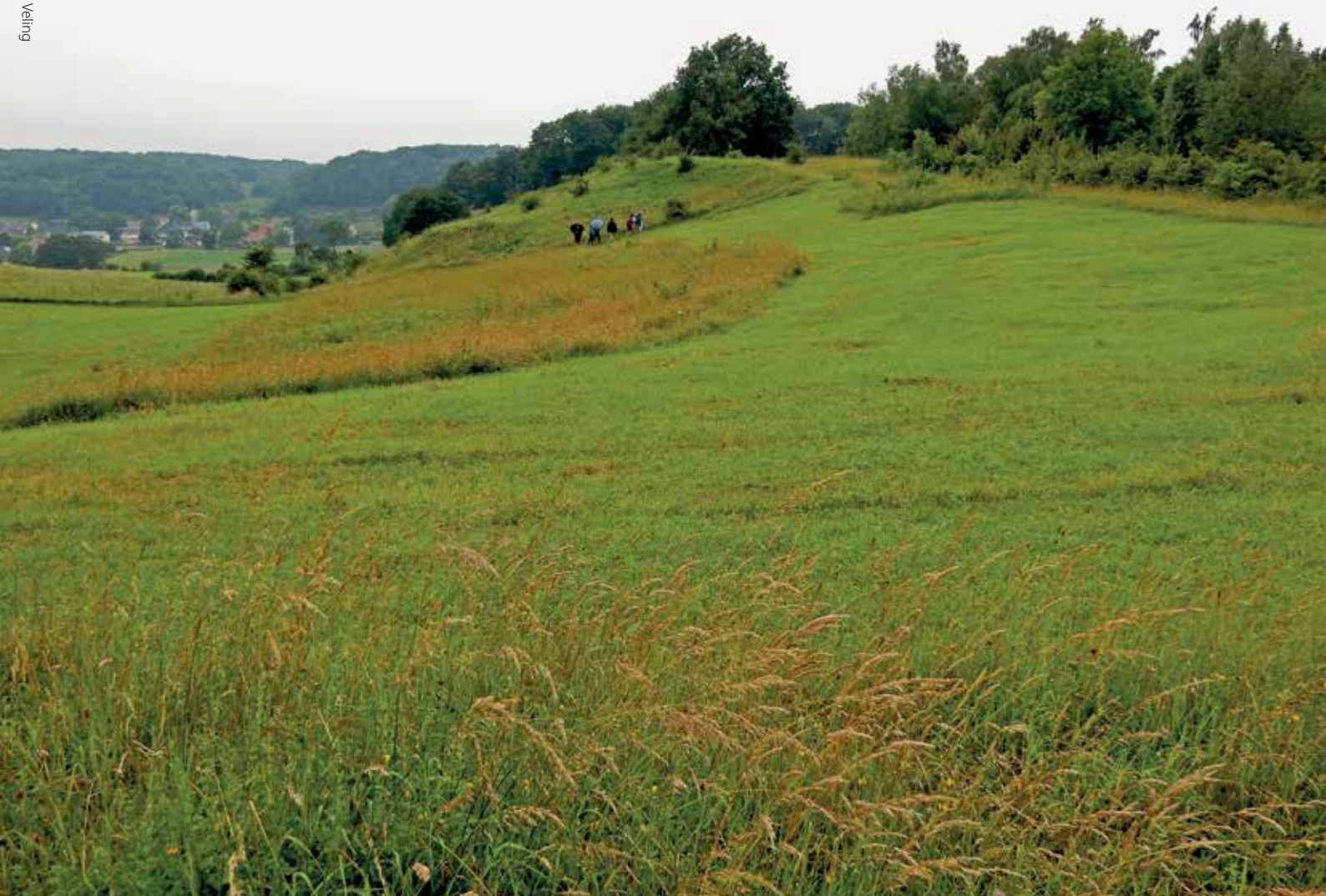
Voorbeeld van gefaseerd maaien op de Sint-Pietersberg.