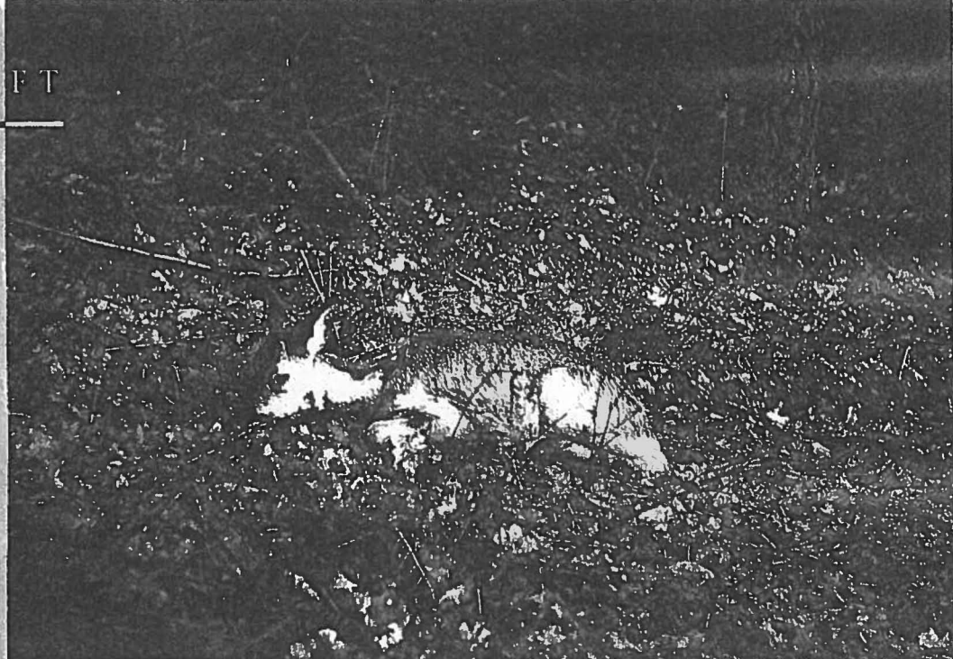
Der Befall mit Lungen-, Magen- und/oder Darmwürmern gehört zu den häufigsten Erkrankungen beim Rehwild. Der Parasitenbefall führt zu Gewichtsverlust und kann im Extremfall tödlich enden

Signifikante Unterschiede im Befall mit Magen- und Darmparasiten wurden zwischen den Stichproben aus Röttgen und Königsforst ( p < 0,01 ) sowie Röttgen und Wälderheide ( p < 0,05 ) festgestellt. (MANN-WHITNEY