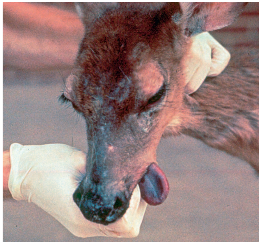
Een witstaarthert in Noord Amerika met EHDV-infectie (Bron: Dr. Kevin Keel, SE Cooperative Wildlife Disease Study, College of Veterinary Medicine, The University of Georgia, Athens, Georgia, USA).

Het EHDV gaat in cellen van bloedvaten van gevoelige diersoorten zitten en maakt deze kapot. Hierdoor ontstaan bloedingen, vochtuitreding (oedeem), trombose en sterft weefsel af. Met het oog zijn onder andere roodkleuring, zwelling en ontsteking van neus- monden oogslijmvliezen (zie foto) en van uier en tepels waarneembaar, evenals korstvorming op de neusspiegel en de huid, zweren in de mond, kreupelheid en kroonrandontsteking, en soms bloederige diarree. Enkele dagen na infectie ontwikkelen de dieren al