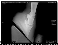
Infectoris vuid bij de zie met het moeilijk te deghaat des (De zijde van de