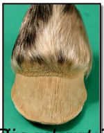
Plaat met licht en donker materiaal bij de hantelste