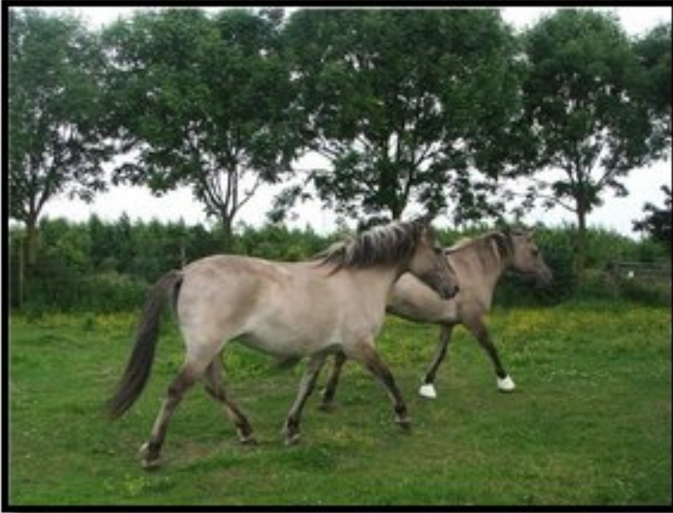
Paard met gipsverband ter voorkoming van verdere kanteling van het hoefbeentje

Friday, 19 March 2010 21:31 - Last Updated Friday, 19 March 2010 21:51