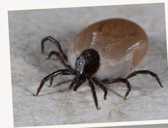
Een goed muizenjaar betekent doorgaans veel (besmette) teken

Gassner en Van Wieren verwachten ook dit jaar weer veel teken. We hebben een warme winter gehad met veel eikels en dus veel muizen. Al die larven hebben zich kunnen voeden aan muizenbloed. Dat worden dit jaar allemaal nimfen en daar hebben wij mensen het meeste last van. Wie veel in veld en bos is, doet er dus goed aan zich regelmatig te controleren, anti-teekmiddelen (op basis van DEET of Citriodiol aan te schaffen) of tekenwerende kleding te dragen. DEET heeft het nadeel dat het slechts een paar uur werkt en teken alleen afstoot. Permetrine (de stof die wordt gebruikt in moderne kleding) gaat langer mee en is voor de teek ook dodelijk. Henk Vandendriessche is werkzaam bij het enige bedrijf in Europa met een licentie voor het verwerken van deze stof in weefsels. Vandendriessche: 'Het is een insecticide dat vroeger massaal over landbouwgewassen werd gespoten. Het zit in allerlei bestrijdingsmiddelen en tast bij contact het zenuwstelsel van de teek aan. Het werd voor het eerst als experiment door het Duitse leger gebruikt in uniformen om de manschappen te beschermen.'