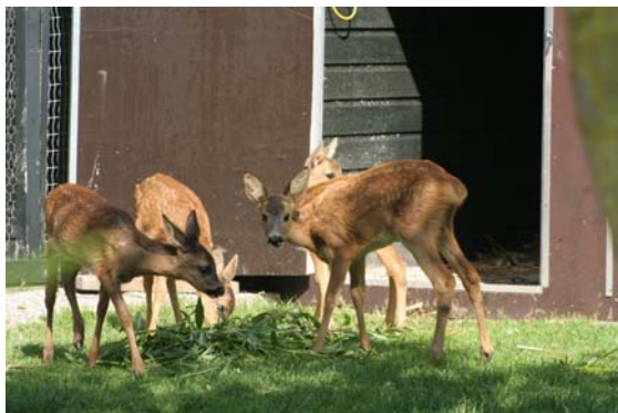
De vier kalfjes in Westernieland

En vier kalfjes zijn verhuisd naar Faunavisie Wildcare in Westernieland. Ze waren al wat ouder toen ze binnenkamen en zijn dan moeilijk in de groep te plaatsen omdat ze veel onrust brengen. Reekalfjes zijn erg schichtig en vier van die kleine druktemakers brengen de hele groep zo van streek, dat er niet één meer voor zijn flesje komt.