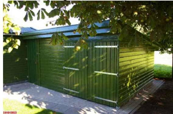
Onze nieuwe opslagruimte

M.A.O.C Gravin van Bylandt Stichting en het Moose Fonds van De Kootje Fundaties voor hun bijdrage hieraan.