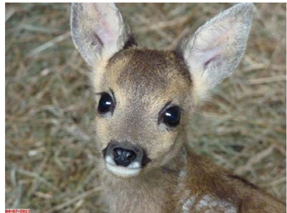
Petra, de ware "Bambi" in het gezelschap

Petra kwam op 30 mei binnen en was met haar 1200 gram de kleinste van dit jaar.