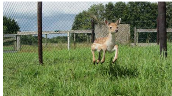
Een blije Stanley, 4 pootjes van de grond

Zoals we hierboven al vertelden, hebben we 4 reekalfjes naar Westernieland gebracht, omdat we ze niet in de groep konden plaatsen. We hebben toen het plan opgevat volgend jaar een tweede kalverweitje te realiseren, speciaal voor dit soort gevallen. De komst van het kleine damhertje heeft echter onze plannen versneld. Stanley mag/moet in tegenstelling tot de reekalfjes wel aan mensen wennen, omdat hij terug geplaatst zal moeten worden in een dierparkje.