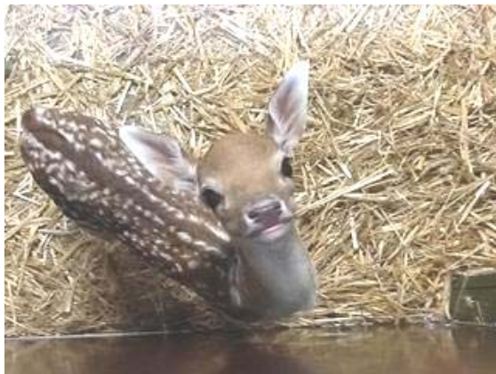
Stanley, 1,5 week oud op deze foto

En op 30 juli werden we verrast met de komst van Stanley, een damhertje. Hij is afkomstig uit een hertenparkje in Stads-kanaal en was pas een paar uur oud toen hij gebracht werd. Zijn moeder accepteerde hem niet. Hij is al flink gegroeid.