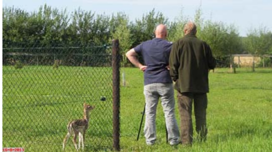
RTV Noord (en een nieuwsgierige Stanley)

Op 16 augustus was RTV Noord weer bij ons voor een reportage. Overdag werd op de radio aandacht aan onze reeënopvang besteed en 's avond in het TV-journaal.