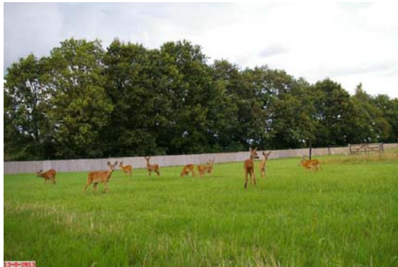
Wat zijn ze groot geworden!

Dit jaar zijn er in totaal 22 reekalfjes bij ons binnengekomen. Drie daarvan zijn helaas overleden. Ze kwamen in zeer slechte conditie binnen en waren niet meer te redden. Inmiddels lopen er 15 in de grote wei.