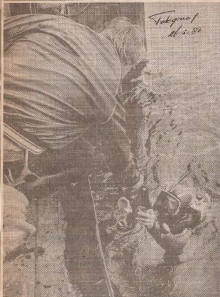
* Duikers halen de gestolen geweien uit de Rijn.

Van onze correspondent OOSTERBEEK, woensdag De rijkspolitie is gisteren begonnen bij Oosterbeek in de Rijn te dreggen naar 120 hertegeweien, die het afgelopen weekeinde zijn gestolen uit een tentoonstellingsgebouw in het Achterhoekse Vorden. Een inwoner van Oosterbeek had twee hertegeweien zien drijven, die afkomstig bleken te zijn van de gestolen collectie.