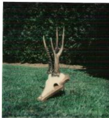
"Fleuopolder" mei 1982