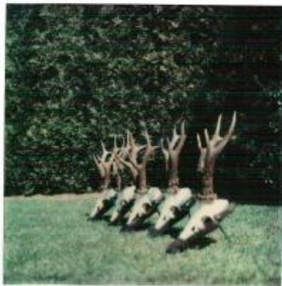
B. Brinkman. mei 1982

Trofeeën gestolen door „Dierenbeeryidingsfro." 24 edelherten. in de nacht van 78 reebakken. 22 op 23 mei 13 keilers 7 mouflons.