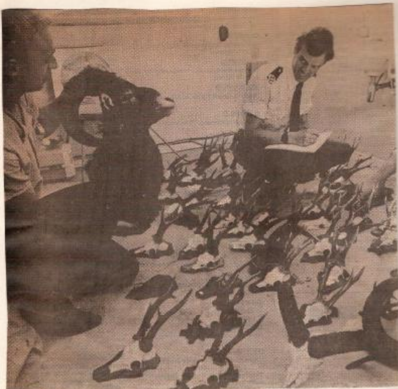
Two Vordense politiemensen bezig met het inventariseren van de bij het Driese veer gevonden trofeeën