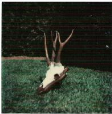
"drie stangen bok"

Trofeeën gestolen door „Dierenbeeryidingsfro." 24 edelherten. in de nacht van 78 reebakken. 22 op 23 mei 13 keilers 7 mouflons.