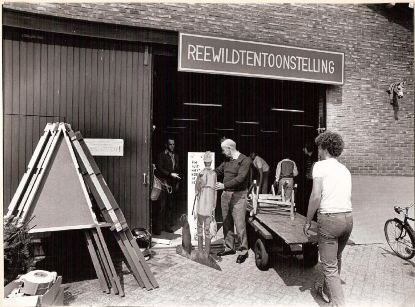
Zondagmiddag werden de restanten van de show opgeruimd