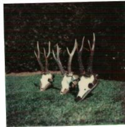
"Fleuopolder" mei 1982