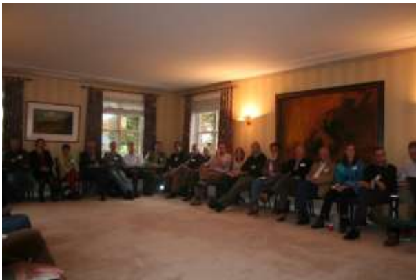
Inhoudelijk deskundigen luisteren tijdens de discussie naar elkaars argumenten