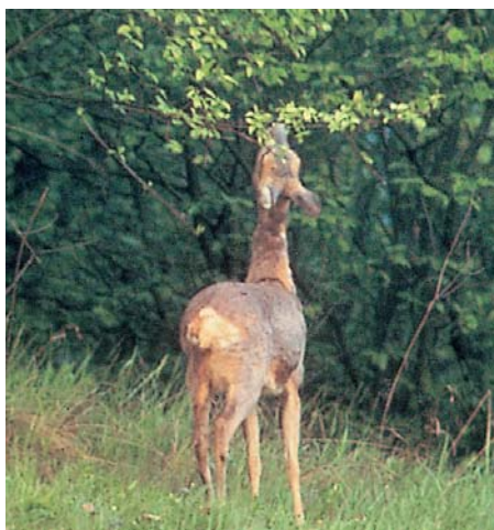
Rehwild verbeißt, schlägt und fegt

und die Wildschadensbeurteilung zusammengestellt. Die Skizzierung eines Ursachen- und eines Maßnahmenschemas soll die Vorbeugung gegen Wildschäden und die Behandlung bestehender Wildschadensprobleme erleichtern. Dem Leser