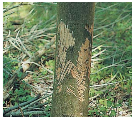
Schälung durch Hasen oder Kaninchen

Der mehr als 200 Fotos umfassende Diagnose-Bildatlas dient der richtigen Erkennung von Trittwirkung, Keimlingsverbiß, Baumverbiß, Fegen (Schlagen) und Schälung. Dabei werden die verschiedenen Verursacher, die Verwechslungsmöglichkeiten und die jahreszeitlichen Unterschiede erkenntlich gemacht. Weiters sind die Aussagekraft von Kontrollzäunen zur objektiven Beurteilung des Wildeinflusses sowie verschiedene Schutzmaßnahmen gegen Verbiß-, Fegen- und Schälungen dargestellt. Die umfangreiche Zusammenstellung von Fotos soll dem Praktiker helfen, möglichst viele Informationen aus dem Erscheinungsbild der von Wildtieren genutzten Bäume und Sträucher sowie des Waldbodens herauszulesen. Dadurch können Fehlinterpretationen und Verwechslungen leichter vermieden und eventuell notwendige Gegenmaßnahmen wirkungsvoller durchgeführt werden.