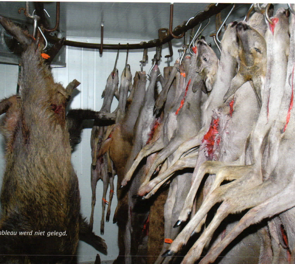
Tableau werd niet gelegd.