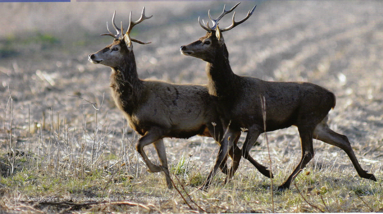
In de Staatsforsten werd radicaal ingegrepen in de roodwildpopulatie.

Voor veel jagers zal de jacht in Duitsland en de manier waarop deze geregeld is, een droom zijn. Als men het jagen in Nederland en België met Duitsland vergelijkt, is dat ook geenszins verwonderlijk. Duitsland biedt aan veel jagers prachtige jachtvelden met goede en gezonde wildbestanden, en als jager heeft men vele vrijheden en aanzien. Niet op de laatste plaats hebben we dat te danken aan het Deutscher Jagdschutzverband (DJV) en de Landesjagdverbände, die in het verleden met hand en tand voor de belangen van de jagers en het wild zijn opgekomen. Jagers in Duitsland zijn daardoor altijd een serieuze en gerespecteerde gesprekspartner op het gebied van jacht en natuurbeheer gebleven en ook de samenwerking met grondgebruikers en de Staatsforsten verliep over het algemeen harmonisch. Desondanks is er in Duitsland sinds een aantal jaar een ontwikkeling gaande, die een ernstige bedreiging voor de jacht, zoals wij die nu kennen, vormt.