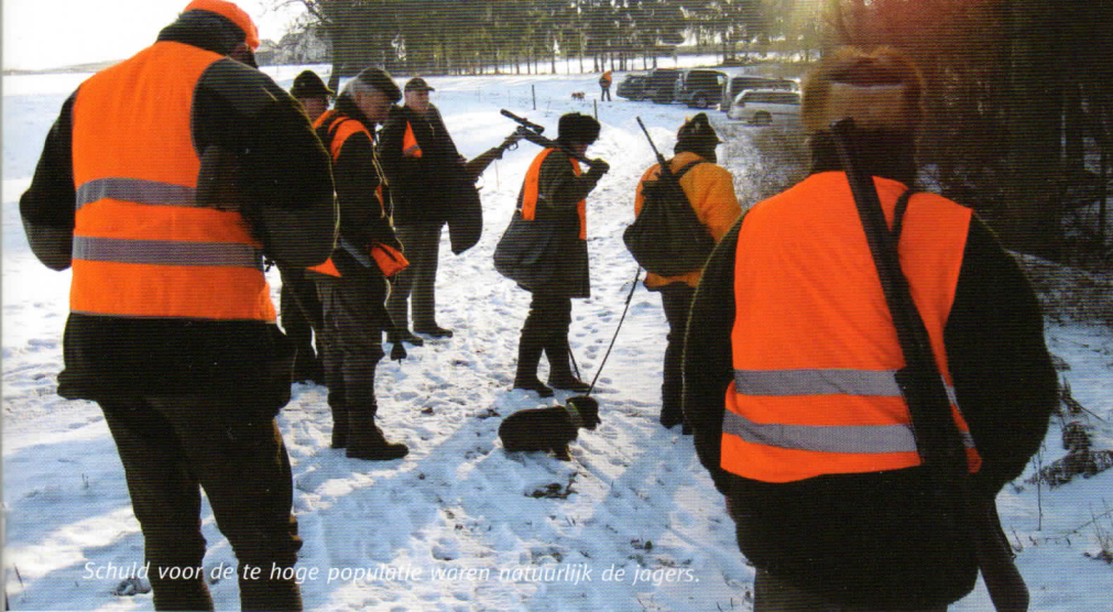
Schuld voor de te hoge populatie waren natuurlijk de jagers.

en ook bij bepaalde organisaties die al sinds jaren een gerichte campagne tegen de jacht voeren. Laatstgenoemden zijn net als hun geestverwanten in Nederland, niet geïnteresseerd in de grondigheid van wetenschappelijke onderzoeken. De hoofdzaak is: men heeft een stok om jagers mee te slaan. Met dit onderzoek hebben ze er weer zo eentje cadeau gekregen.