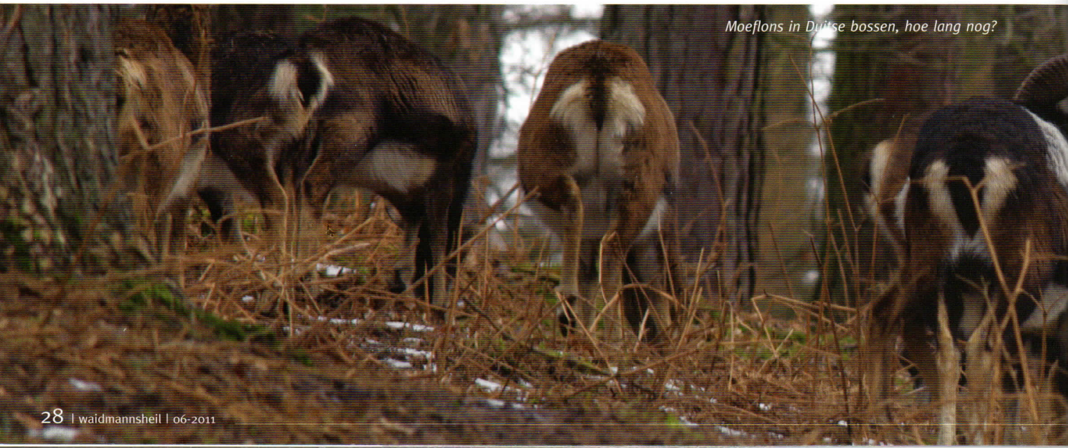
Moeflons in Duitse bossen, hoe lang nog?

Hoe een dergelijke conclusie mogelijk is in een land, waarin jaarlijks bijna 200 vierkante kilometer bos bij komt en waar juist de politiek van de Staatsforsten en de private grootgrondbezitters ertoe bijdraagt dat de meeste bossen zich verre van natuurlijk ontwikkelen, is onbegrijpelijk. Decennia lang heeft men op grote schaal snel groeiende monoculturen boven heterogene loofbossen verkozen. Monoculturen die ook nog regelmatig van onderen opgeschoond worden, zodat de heren beter met de harvester door het bos kunnen rijden. Van natuurlijke bossen is daarbij geen enkele sprake. Dat het wild er nu plotseling de schuld van krijgt, dat er te weinig natuurlijk bos in Duitsland zou ontstaan, is niet alleen een grove brutaliteit, maar ook een ernstige reden voor twijfel aan de objectiviteit van de onderzoekers. Die twijfel wordt versterkt door de grote discrepantie die er bestaat tussen het bovengenoemde onderzoek en een vrijwel gelijktijdig uitgegeven publicatie van hetzelfde Bundesamt für Naturschutz. In deze publicatie over de risicofactoren voor het bos staat namelijk de bosbouw zelf met 70% op de eerste plaats, gevolgd door uitlaatgassen met 40%. Wildschade en invloed van de jacht komen pas op plaats 14 met een risicofactor van 15%. Wat de onderzoekers van het Wald-Wild-Konflikt tot hun conclusie heeft doen komen, kunnen we alleen maar vermoeden, maar feit is wel dat een dergelijk onderzoek in goede aarde valt bij naar winst strevende private en publieke bosbouwers,